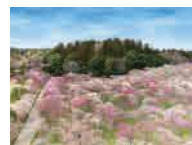
水戸の梅まつり(偕楽園)