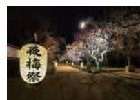
夜・梅・祭(弘道館)

今回は、多くの受賞歴を持つ自慢のチーズと、新進気鋭のワイナリーによるワインをご用意しました。水戸を訪れたことのある方にも、これから訪れるという方にも、魁のまち・水戸を感じるひとときとなれば幸いです。