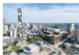
中心市街地のMitoriO(ミトリオ)地区

水戸市は、茨城県のほぼ中央に位置する県庁所在地です。古くは水戸徳川家の城下町として栄え、緑豊かな自然をはじめ、歴史や文化、芸術、サッカー・バスケのプロスポーツなど、多彩な魅力にあふれるまちです。特に、日本三名園の一つである偕楽園や日本最大規模の藩校である弘道館などは、全国からも多くの方が訪れます。