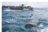
イルカウォッチング(天草市)