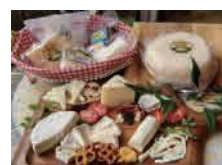
森のシェーブル館のチーズ

今回は、多くの受賞歴を持つ自慢のチーズと、新進気鋭のワイナリーによるワインをご用意しました。水戸を訪れたことのある方にも、これから訪れるという方にも、魁のまち・水戸を感じるひとときとなれば幸いです。