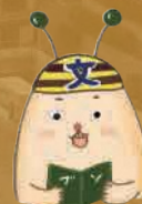
ふんたろう (文京区観光協会キャラクター)

← Sky View Lounge BAR の最新情報・詳細は左記 QR コードまたは下記 URL からご確認ください。 https://x.gd/a2nJn