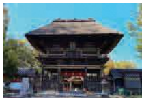
青井阿蘇神社(人吉市)