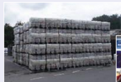
▲工場前に積み上げられたペットボトル