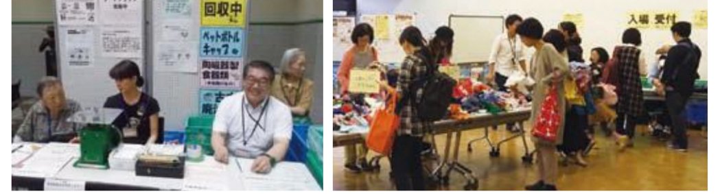
「ステージ・エコ」にて(資源回収ブースで)