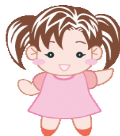
3R推進キャラクター リサちゃん