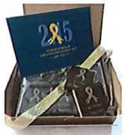
チョコレート (6個入り)