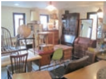
家具の展示・販売