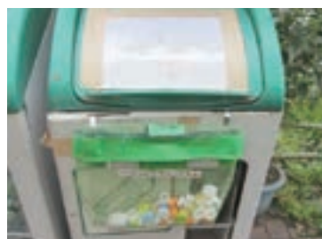
ペットボトル回収ボックス