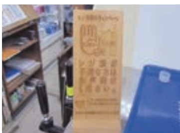
レジ袋不要キャンペーンの表示