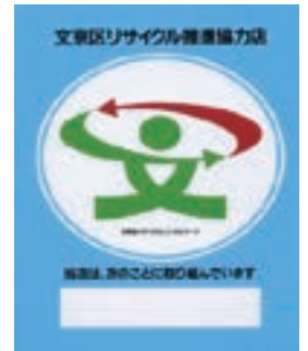
リサイクル推進協力店マーク

文京区では、廃棄物の削減と資源の有効活用に取り組む店舗を「リサイクル推進協力店」に登録し、皆さまにご紹介しています。