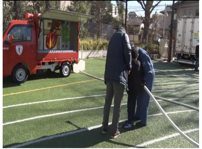
まちかど防災訓練車