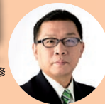
成澤廣修 文京区長