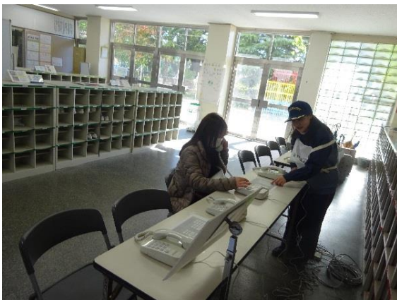
災害時特設公衆電話