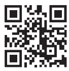
医療機関情報検索システム