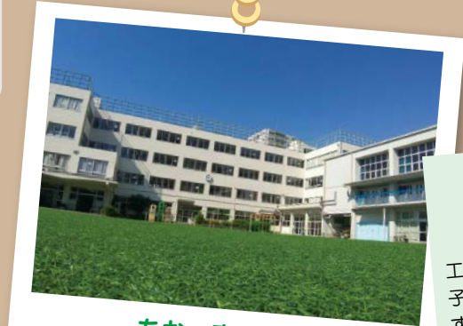
あお 青 蒼

音羽中学校では、冬限定ですが部活動や委員会を頑張り、遅くまで残った人特権できれいな夜景を見ることが出来ます。特に4階や5階などの少し高いフロアで見る夜景は格別です。そんな夜景は部活動や委員会を頑張った私たちを癒してくれます。