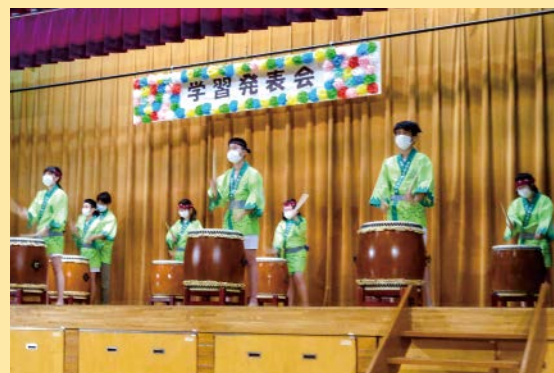
▲学習発表会の様子

校風、生徒の様子、授業内容、部活動、学校行事、進路状況など具体的な学校生活全般を説明します。学校説明会への参加は、自分に合った進学先を見つける絶好の機会です。気になる中学校へ行き、進学への疑問や不安を解消してください。