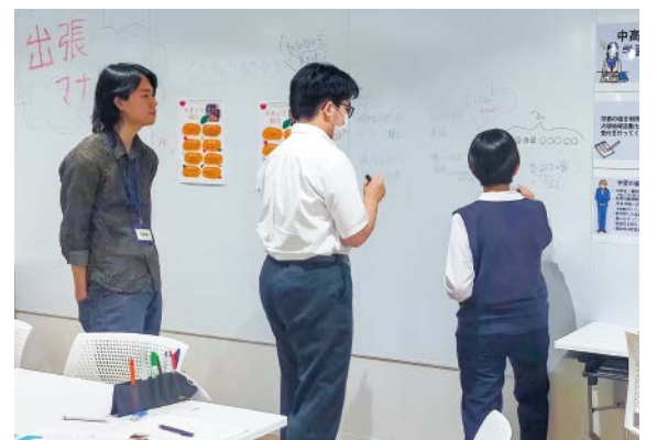
▲壁面ホワイトボードに計算式を書く生徒

マナビ場は、開催時間内であれば、好きな時に来て好きな時に抜かれる気軽な勉強場所です。学校終わりにひとりでふらっと訪れても、友達と一緒に来ても大丈夫。マナビ場で楽しく学んでみませんか。ご参加をお待ちしております。