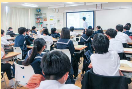
▲クラス授業の様子

区立中学校の授業の様子や、教科担任制の授業内容についてご覧いただけるよう、文京区では年間8回の土曜授業公開を実施しています。授業公開日には、道徳授業地区公開講座等も適宜開催しております。生徒や学校の雰囲気を感じられる貴重な機会をご活用ください。