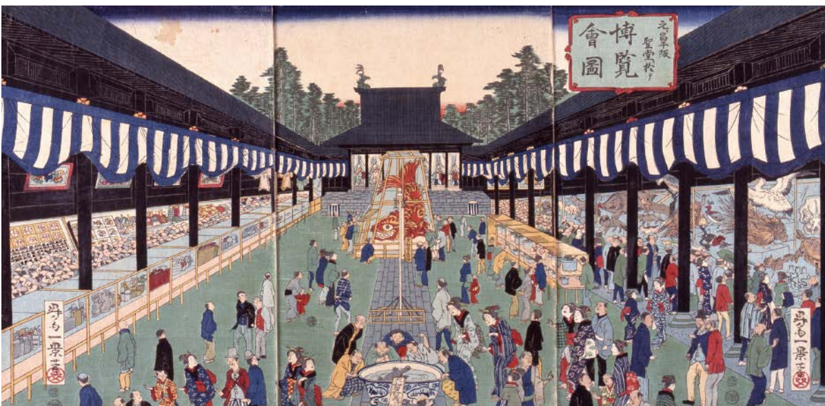
▲「元ト昌平坂聖堂二於テ博覧会図」(ふるさと歴史館蔵)

文京ふるさと歴史館特別展 「湯島の地に聖堂あり —江戸・東京の学び舎と文京—」 会 期 10月28日(土)～12月10日(日) 開館時間 10:00～17:00 休 館 日 毎週月曜日 入 館 料 一般:100円 団体(20人以上):70円 中学生以下・65歳以上・ 友の会会員は無料 ※11月3日文化の日は無料公開日 ※文京区立森鷗外記念館入館券の 半券を持参の方は、団体料金で 入館できます。 会 場 文京ふるさと歴史館 文京区本郷4-9-29 URL https://www.city.bunkyo.lg.jp/bunka/kanko/spot/museum/rekishikan/ ※詳しい内容や開館情報は文京ふるさと歴史館の ホームページなどでご確認ください。 電 話 文京ふるさと歴史館 03(3818)7221