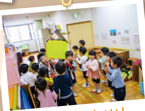
祭りだ！わっしょい！

今年はお祭りも例年通りのにぎわいを見せ、子どもたちもいろいろな体験をしてきました。幼稚園でもお祭りごっこを楽しみます。出店を作ったり、法被を着て神輿を担いだりしました。「わっしょい、ゆしま！まつりだ、ゆしま！」威勢のいい掛け声が聞こえています。