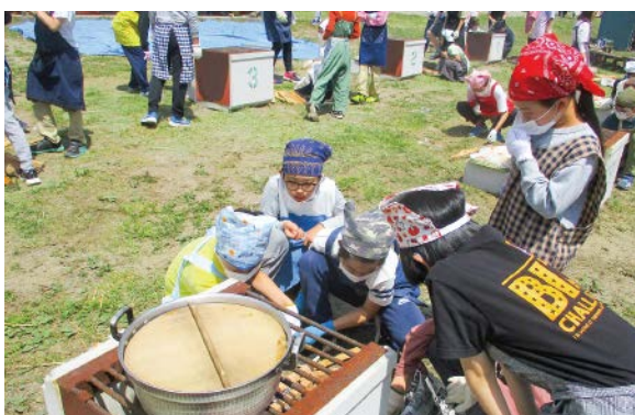
▲ほうとう作り(小学校)