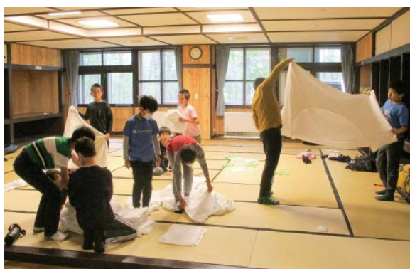
▲部屋の片付け(小学校)