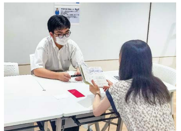
▲英単語クイズにチャレンジしている生徒

ビーラボ b-lab(文京区青少年プラザ) ☎03(5800)2731 児童青少年課青少年係 ☎03(5803)1186