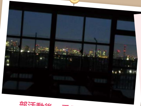
部活動後・委員会後の夜景

今号も区立の幼稚園や小・中学校自慢の映えスポットをご紹介します。どの写真もそれぞれの魅力があふれていますね！