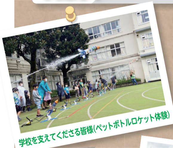
学校を支えてくださる皆様(ペットボトルロケット体験)