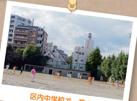
区内中学校で一番！

区内10校ある中学校の中で一番広い校庭を持つ三中は、150mトラックをつくることができます。僕達三中生の昼休みの楽しみは「校庭に出てサッカーをすること」、サッカー部も都大会出場を目指し頑張っています。