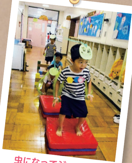
虫になってジャンプ！

本校の自慢は、地域やPTA、同窓会等、学校を愛し支えてくださる皆様です。たいさん木の広場の皆様は、校庭開放や各種イベントで子どもたちを楽しませてくださっています。写真は、恒例となっているペットボトルロケット体験の様子です。