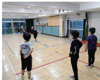
ホールで遊ぶ子どもたち

週替わりの工作コーナーには、「今日の工作なあに？」と、工作好きたちが集まります。じっくり作品に向き合う子、「どうやるの？」と戸惑いながらも頑張る子……「できたよ！」と完成した作品をお友だちや職員に見せに行くときは笑顔です。図書コーナーではお気に入りのマンガを広げてリラックス。人