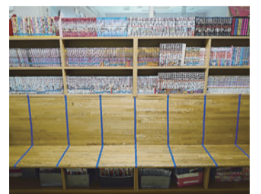
自慢の図書コーナー

児童館が乳幼児さん親子から小学生、そして大きくなってからも、地域の中で気軽に立ち寄れる場所、ホッとできる場所であればと思います。ぜひ、遊びに来てください！