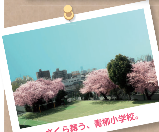
さくら舞う、青柳小学校。

今号も区立の各幼稚園や小学校、中学校自慢のきあら映えスポットを紹介します。どれも良い写真で、とても映えていますね！