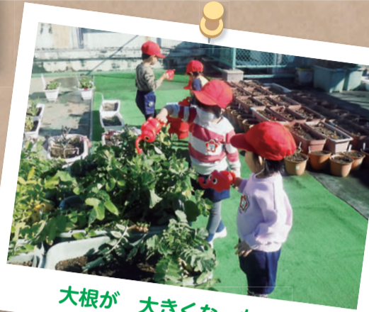
大根が 大きくなったね！

護国寺の境内の中、高台にある本校。広い青空の下、3月には、満開の桜が6年生を見送り、4月には1年生を迎えます。豊かな自然や暖かな日差し等に見守られ、児童はのびのびと自己表現をし、人との関わり合いを大切にしながら学校生活を送っています。