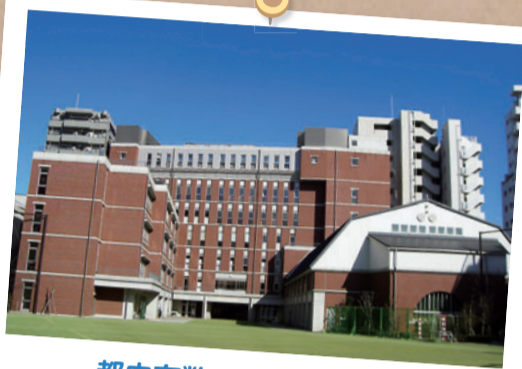
都内有数の近代的な校舎

第六中学校の自慢は、何と言っても平成25年度に改築、落成した地下1階、地上7階建ての校舎です。都内有数のとても恵まれた環境の中で、生徒は落ち着いた学校生活を送っています。