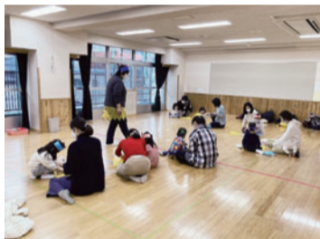
乳幼児活動の様子

午前中は乳幼児親子の自由なあそび場として利用できます。ホールではすべり台、コンピカー、三輪車、プラレール、乳幼児用のおもちゃ