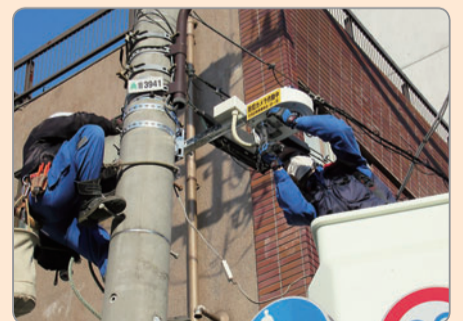
防犯カメラ設置工事の様子