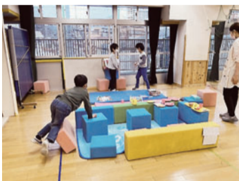
ホールで遊ぶ子どもたち

小学生はボール遊びや積み木遊び、人気のマンガも全巻そろっているので全集中で読破してい