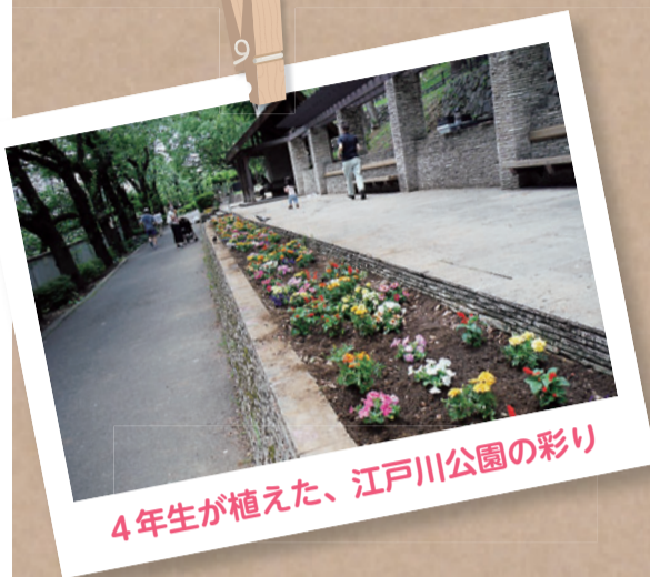
4年生が植えた、江戸川公園の彩り

今号も区立の各幼稚園や小学校、中学校自慢のきあら映えスポットを紹介します。各校・園それぞれの良さが光る写真たちですね！