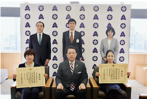
優良PTA文部科学大臣表彰 (右：青柳幼稚園 左：文林中学校)

駒本小学校では、平成20年度に学校支援地域本部を立ち上げ、学校が求める支援を保護者や地域と協力しながら実施しています。多岐にわたる活動の中でも、地域と学校が協働で推進するインクルーシブ教育や地域での親子支援を目指した「子ども食堂」の運営に力を入れて活動しています。地域活動に目を向け、学校を基盤とした活動を通じ、課題解決に向けて行っている幅広い取組みが評価されました。