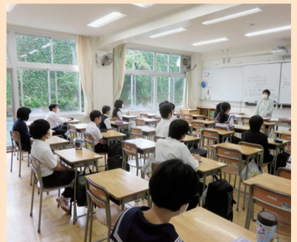
少人数クラス授業の様子

スポーツや文化及び科学に親しみ、意欲や興味・関心を高めるとともに、責任感、連帯感を養うため、教育活動の一環として展開しています。「文京区部活動ガイドライン」に基づいた部活動指導員を導入し、高い専門性をもった指導員が指導することで、生徒の技術向上、健全育成等に役立てています。