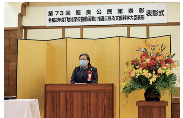
表彰式での代表挨拶 (駒本小学校)