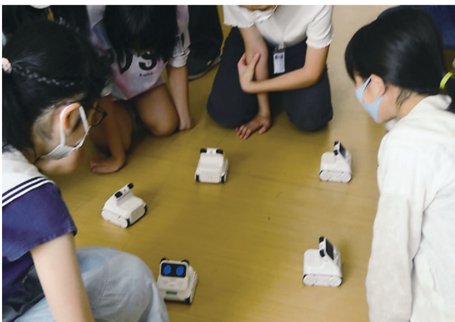
ロボットを持ち寄って同じ動作をさせています