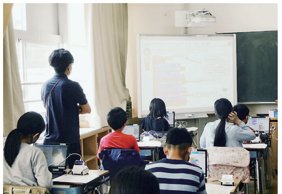
皆さん真剣に授業を受けています