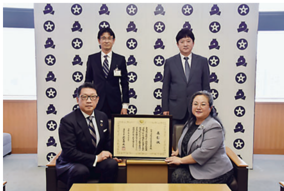
地域学校協働活動推進に係る文部科学大臣表彰 (駒本小学校)