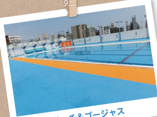
リッチ&ゴージャス

昨年度プールサイドを改修し、ブルーやオレンジのハイセンスな趣に変身したプール。スカイツリーを仰ぐこともでき、ビーチやリゾートにあるホテルプールをも思わせる、ちょっぴり豪華な絶景スポット、これが第八中の自慢です。