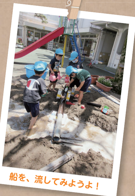
船を、流してみようよ！

本校の南側、階段を降りたところに神田川が流れています。その神田川の脇にある江戸川公園の花壇はいつも色とりどりの季節の花が咲いていて、歩行者の目を楽しませています。この花は区のみどり公園課の協力のもと、本校の4年生が年に3回、心をこめて植栽をしているものです。