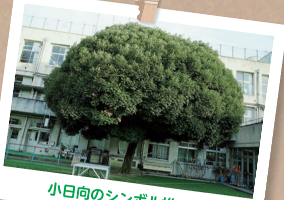
小日向のシンボル椎の木

本校には大きな椎の木があります。現存の椎の木は3代目になります。暑い夏の日には大きな木陰をつくり、爽やかな風が吹き抜けていきます。雨の日も風の日も、どっしり構えて子どもたちを見守っています。