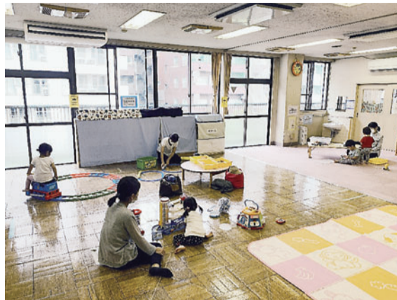
午前中の乳幼児親子の様子

月・火曜は誰でも参加できる「なかよしひろば」、水曜は0歳児対象の「おおきくなったね」、木・金曜は登録制の幼児クラブ「ぞうさんクラス(木曜、2歳児対象)」、「くまさんクラス(金曜、1歳児対象)」を行っています。そのほかにも不定期ですが、「リトミック」や「ベビーバレエ」などの行事も開催しています。詳細は区ホームページ等をご覧ください。