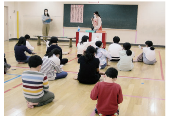
みんな楽しみピンゴ大会

ています。コンテストでは毎回素敵な作品がたくさん集まり、子どもたちの発想の豊かに驚かされます。