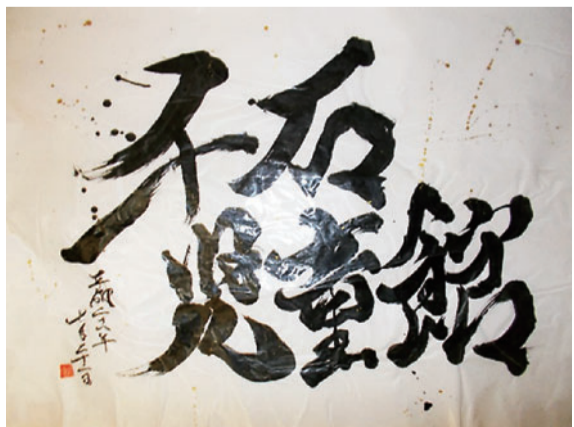
書道イベントの講師に書いていただいた筆文字

児童館の中に2つの育成室と子育てひろばがあり、児童館をあわせた4つの施設があることも特徴の1つです。