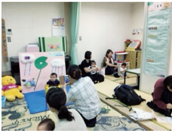
「インスタ映え」のスポットに

「あかちゃんタイム」では、0歳児のお子さんを対象に身長、体重測定と手形、足型取りができ、さらに、お子さんの成長の1ページにと、毎月の季節に合わせた背景の前で写真撮影ができるコーナーは人気のコーナーになっています。