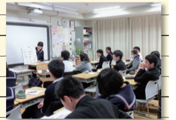
道徳授業地区公開講座