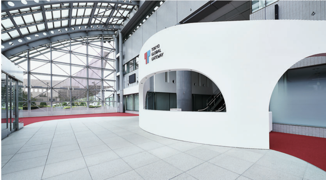
近未来的な空港をイメージしたエントランス

TOKYO GLOBAL GATEWAY(TGG)とは、東京都教育委員会と株式会社TOKYO GLOBAL GATEWAYが提供する、体験型英語学習施設のことで、平成30年9月、江東区青海にオープンしました。