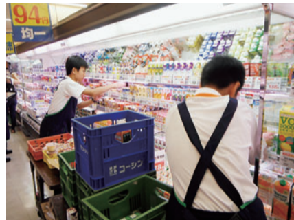
スーパーで商品の陳列を行う様子

自らの生き方を主体的に考え進路を選択できるよう、職場体験を通じて望ましい勤労観・職業観を育むことを目的とした指導を行っています。