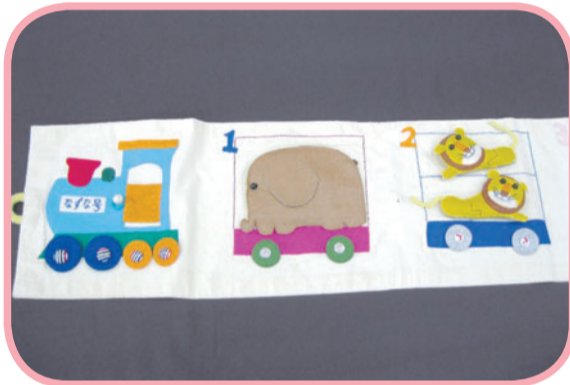
「きしゃぼっぼ」なずな会制作

区では、水道端図書館と小石川図書館で所蔵しており、貸出もしています。30年以上にわたりライブラリーパートナー(=ボランティア)として活動している「なずな会」(水