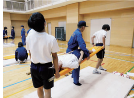
担架を使用した運搬方法を学ぶ

東日本大震災の経験から、自助・共助の精神を養い、地域の防災・減災に貢献できる人を育てることを目的に行っています。消防署、地域、NPO等の協力を得て、各校で工夫したプログラムに取り組んでいます。