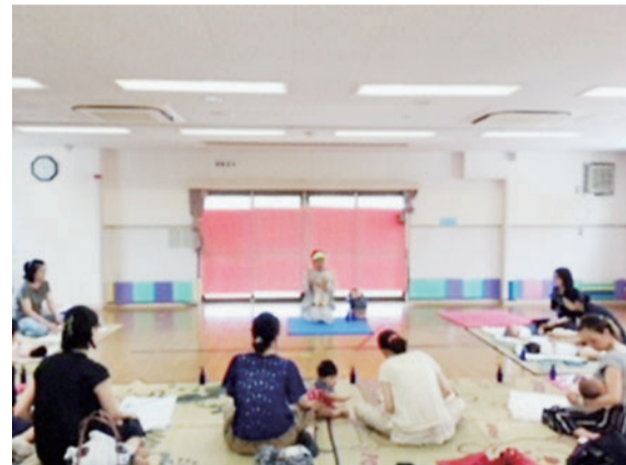
イベント「ベビーマッサージ」

保護者の方とお子さんのスキンシップや保護者の方のリラクスの場として、また、子どもたちにいろいろな体験を楽しんでもらえる場として毎回、ご好評いただいております。