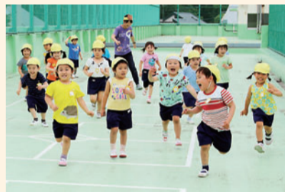
鬼遊びで先生に捕まらないように逃げる子どもたち

今年度、開園50周年を迎えます。50年の歴史を大切にし、これからも発展し続ける幼稚園でありたいです。