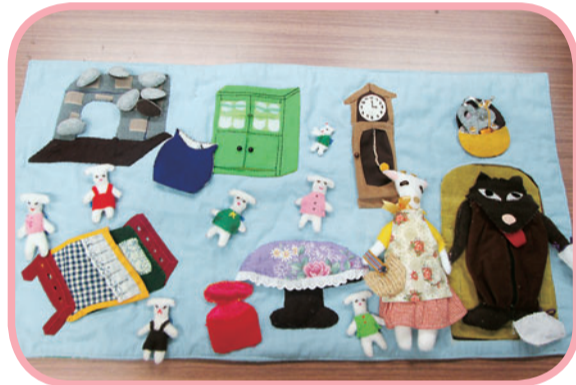
「おおかみと七ひきのこやぎ」小石川図書館布の絵本を作る会制作

色鮮やかで温かく、子どもたちが遊ぶことを考慮して丈夫に作られており、ひと針ひと針、心をこめて作られています。