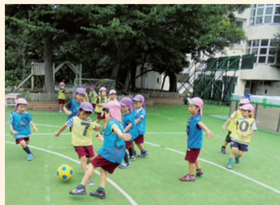
ワールドカップごっこに夢中な子どもたち

同じ敷地内にある小日向台町小学校5年生と5歳児が「5・5交流」を行っています。共に遊ぶことで顔見知りになり、園児は給食体験を通じて小学校入学への期待を高めていきます。隣り合っているからこそ、連携交流がしやすい環境です。