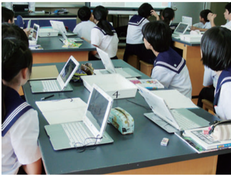
タブレットPCを使用した授業の様子