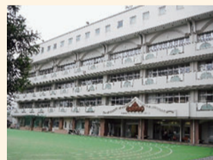
12年目を迎えた校舎

建学の精神である三つのシンボルを大切に受け継ぎながら、「一人一人が輝き、活気あふれる学校」を目指して、教職員一丸となって取り組んでいきます。