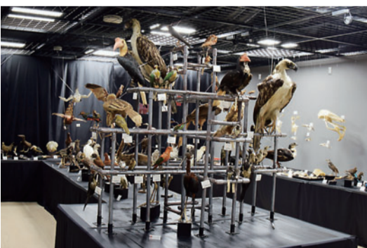
「標本の世界 鳥」展示の様子

古今東西を問わず、鳥は人々の敬意を集める存在です。その訳は、空を飛ぶことができるという、生身の人間にとって不可能なことを華麗にも見せてくれるからでしょう。鳥の美は、そうした鳥を見る人間の憧れと無縁ではないでしょう。「標本の世界」は、鳥と対面する機会としましょう。東京大学が古くから集め続けてきた鳥類標本は、飛ぶことを可能にする鳥の体の機能美を物語り、博物館標本の魅力を伝えてくれるはずです。