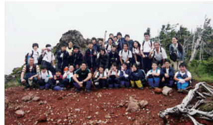
八ヶ岳移動教室での登山

移動教室および林間学校では、八ヶ岳高原の広大な自然の中で普段できない体験を通じて、豊かな人間関係づくりを育んでいます。