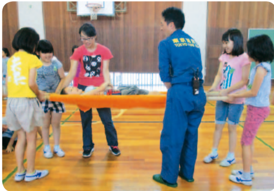
消防署員の指導のもと担架を手作りします