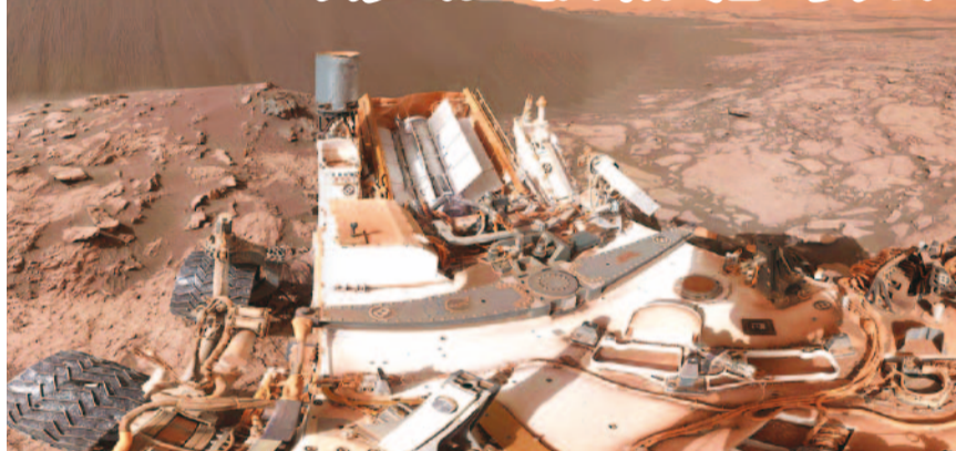
火星のクレーターを調査中の火星探査車「キュリオシティ」

星衛星探査計画(MMX)は、世界の注目を集める「火星圏からのサンプルリターン計画」です。