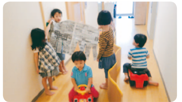
区立お茶の水女子大学こども園での様子

柳町こどもの森と明化幼稚園は、小学校の改築に合わせ、園の改築も予定されています。