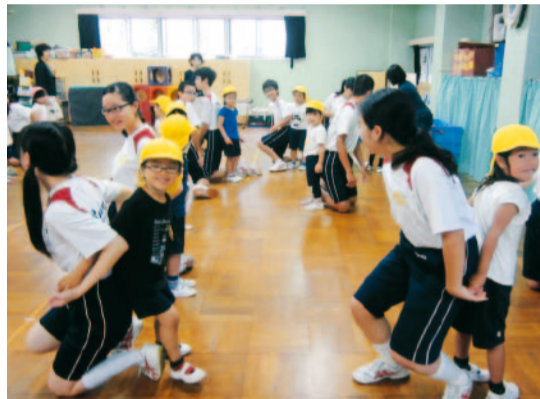
中学生と園児との交流

今後も、子どもたちの「育ち」と「学び」の適時性と連続性を重視した教育活動を推進するとともに、保幼小中の異なる校種間において、共通の目標を軸に、発達段階に応じた連携教育の充実を図っていきます。