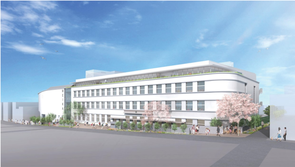
■北側前面道路側外観