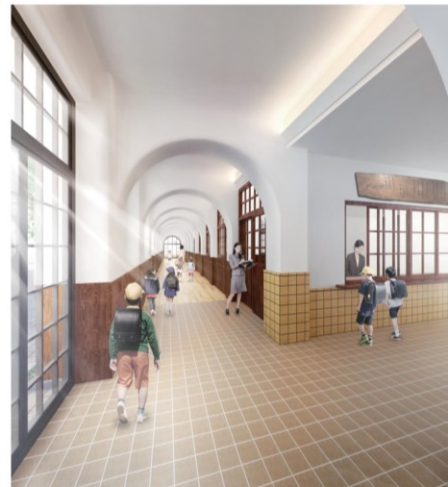
■昇降口からみた明化ホールの廊下