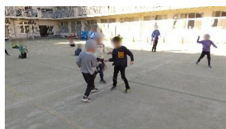
おうさまと 王様取り