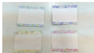
オリジナルポストカード