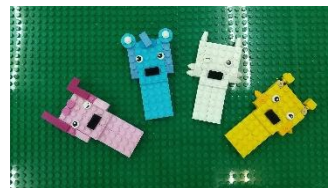
そつぎょうせい 卒業生がつくったレゴの作品