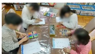
て 手づくりカレンダー