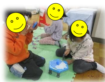
新しいおもちゃ！ アイスクラッシュゲーム！