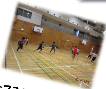
リーフスポーツでは、先生と ドッジボール対決！！