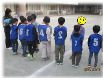
校庭を全面使って、サッカー教室を 行いました！