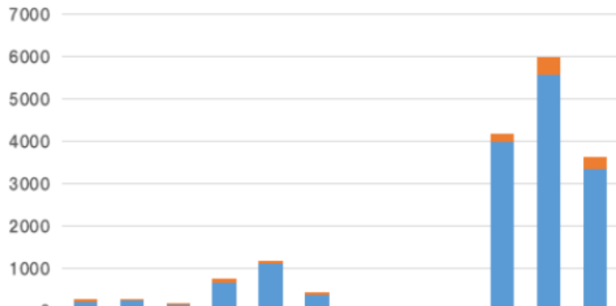
令和3年度月別陽性者数(令和4年3月31日時点:17,028名)