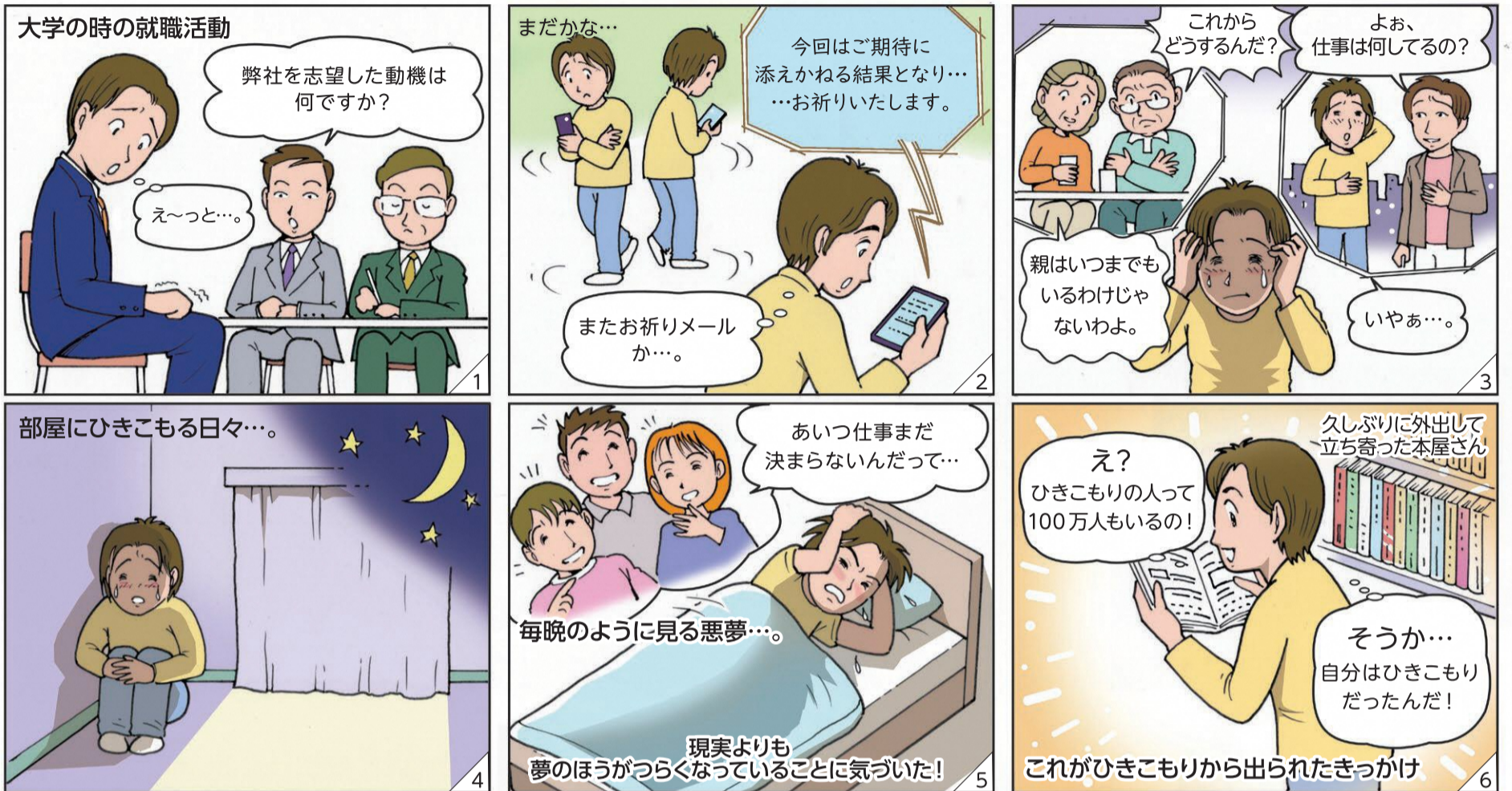
岡本圭太氏 (6月STEP事業講演会の講師) の著書『ひきこもり時給2000円』からのエピソードより