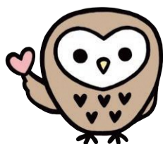
ひきこもり支援センターキャラクター ホウさん