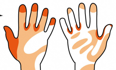
●手の甲 ●手掌(手のひら)

手洗いで一番大切なことは、できる限りこまめに洗うことです。指先・指の間・親指・手首まで、意識してしっかりと洗ってインフルエンザを予防しましょう!