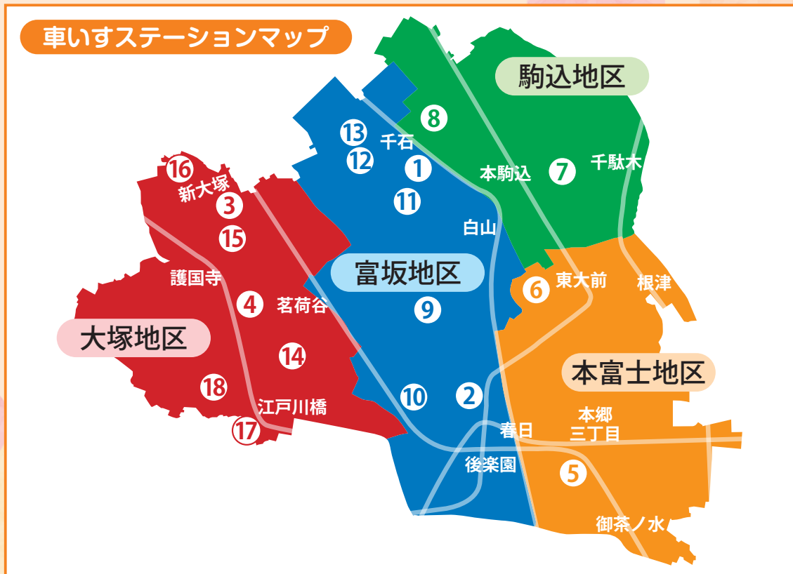
車いすステーションマップ