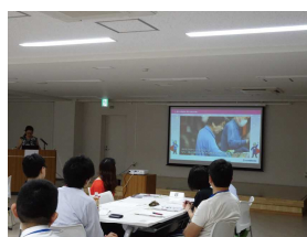
▲支援者の研修会で講演して頂きました。