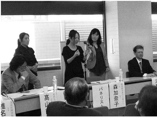
聴覚障害の立場から手話を交えた意見表明