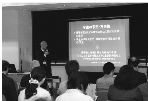
障害者計画のポイント

今回の計画見直しの作業では、障害のある当事者や団体等へのヒアリング調査、障害種別ごとに意見を聴く場を設けるなど、多様な手法により、当事者の意見が十分反映されるよう努めたことを説明しました。