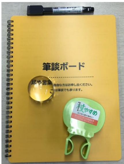
筆談ボード・拡大鏡・杖ホルダー