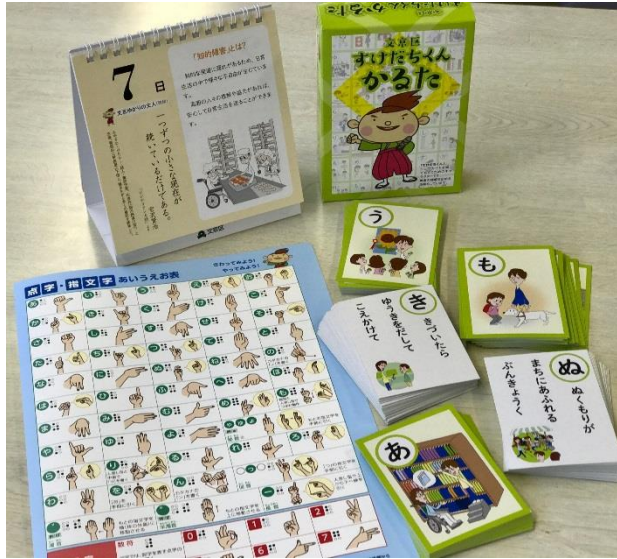
かるた・カレンダー・点字付クリアファイル