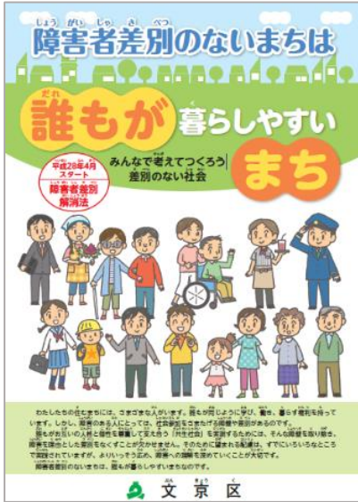
周知啓発用パンフレット