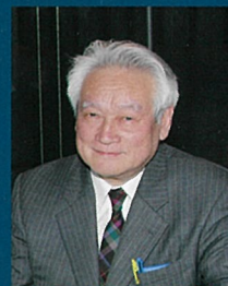
生協さくら病院名誉院長 国際啄木学会評議員

1942年6月1日、福井市生まれ。父の転勤に伴い、神戸・大阪などを経て小学校4年生から高校卒業まで啄木ゆかりの函館で過ごす。1968年、弘前大学医学部卒業、精神医学専攻。八甲病院副院長、1975年以降より院長、2003年より名誉院長。2006年より生協さくら病院(旧八甲病院)名誉院長。国際啄木学会評議員。主な著書に『石川啄木 悲哀の源泉』(2002年、同時代社)、『石川啄木 矛盾の心世界』(2003年、同時代社)、『石川啄木 東海歌の謎』(2004年、同時代社)、『石川啄木 骨肉の怨』(2004年、同時代社)、『啄木と郁雨: 友情は不滅』(2005年、青森文学会)、『石川啄木の友人: 京助、雨情、郁雨』(2006年、同時代社)、『石川啄木東海歌二重歌格論』(2007年、同時代社)、『石川啄木 若者へのメッセージ』(2015年、桜出版)、『石川啄木 不愉快な事件の真実』(2015年、桜出版)、『石川啄木 旅日記』(2015年、桜出版)他精神医学啓蒙書多数。