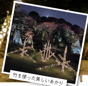
竹を使った美しいあかり