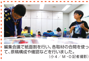
編集会議で紙面割を行い、各取材の合同を使うって、原稿構成や確認などを行いました。

ボッチャは、うまくボールが置きたい場所へ置けないのでむずかしいと思います。けれどみんな楽しんでできるスポーツだと思っています。(小4/C・K記者)