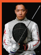
藤田道宣選手 (車いすフェンシング日本代表)