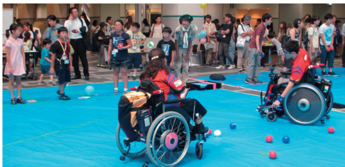
選手と一緒にボッチャを体験!

ボッチャを体験した人に質問することができました。思ったよりもボールが重くて、ころがりやすかったと話していました。さとう選手は、みんなにもっとボッチャを知って、体験してもらいたいと話していました。(小5/A・T記者)