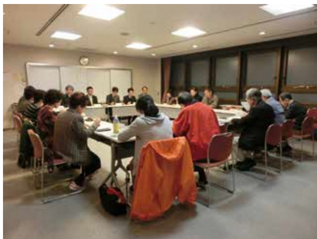
写真：第1回検討会の様子

また、まちづくりに関するルールを定めるための1つの手法である「地区計画」について勉強し、意見交換を行いました。今後は当地区の魅力や課題について話し合い、まち歩き等をしながらか検討を進めていく予定です。