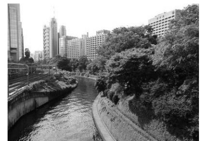
お茶の水橋から上流を見た 神田川の眺め