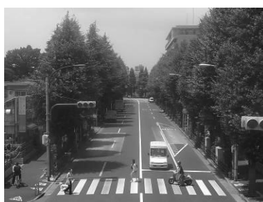
目白通りのイチヨウ並木

区の木としても指定されているイチヨウを始めとして、幹線道路沿いには、街路樹が多く植えられています。春から夏にかけては青々と茂り、秋には黄色に色付くなど、季節によって変化する街路景観を演出しています。