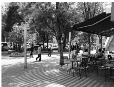
通りと一体となった オープンカフェ (水道橋駅周辺)

まち並みの一角に設置されたオープンカフェや小さなスペースを利用して整備されたポケットパークなどは、都市の中の潤いスポットとなっています。