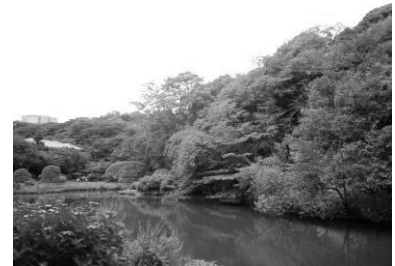
斜面の緑が連なり形成されたスカイライン（新江戸川公園）

斜面地にある豊かな緑は、視覚的に立体感のある景観をつくりだしています。また、一部では連続した緑がつくりだす緑のスカイラインを見られる場所もあり、潤いを感じられます。