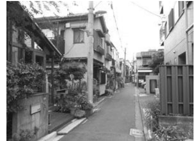
敷地境界を越えて緑が溢れ出している （根津）