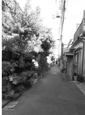
路地と住宅が織り成す 下町の景観（根津）

路地と木造住宅の境界に塀は少なく、敷地内に植えられた緑や鉢植えなどによる緑が溢れ出しており、路地と建物の親密な関係が生む、下町独特の生活感溢れる景観を見ることができます。