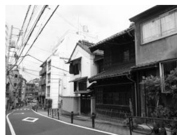
菊坂にある旧伊勢屋質店の土蔵（国登録有形文化財）

住宅地の一角に明治期から昭和初期にかけて建てられた瀟洒な邸宅が残されていたり、商店街の中に歴史ある木造の建物が残されていたりと、区民生活の身近な場所に、多くの歴史の面影を残しています。