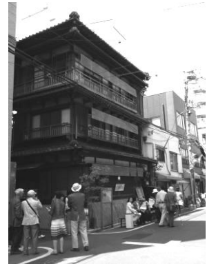
木造3階建ての建物を利用した飲食店(はん亭・根津)