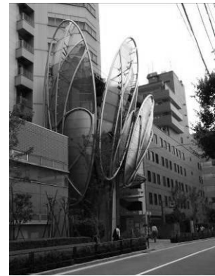
地下鉄飯田橋駅入口の オブジェ（後楽）