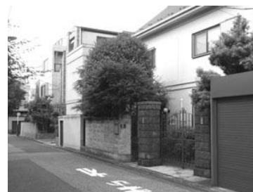
重厚感のある門柱（芦葉家邸宅）

建物だけでなく、通り沿いの特徴的な門や塀なども、まち並み景観をつくりだす重要な要素のひとつであり、歴史の風格を感じることができます。