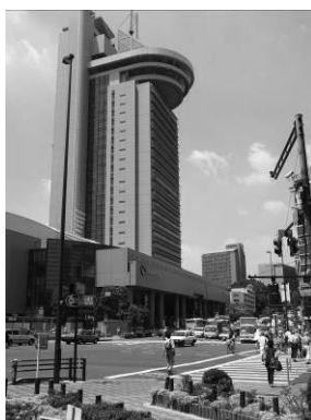
シビックセンター周辺

文京シビックセンター周辺、根津駅・千駄木駅周辺、茗荷谷駅・教育の森公園周辺の地域拠点には、商業施設や事業所、さらにレジャー施設があるなど、人々が集まり、賑わいのある拠点らしい景観が見られます。