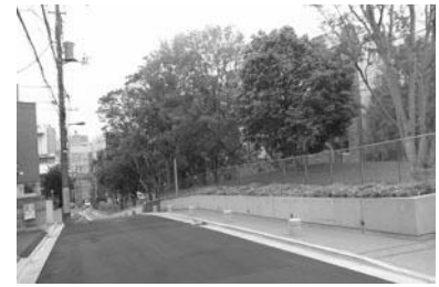
敷地内の緑も見通せる透過性のある塀 (国際仏教学大学院大学)