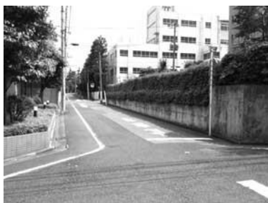
見通しの良い通りと学生会館敷地の植栽（教育の森公園周辺）

教育の森周辺地域では、公園や学校などの大規模敷地も多く、道路沿いの植栽やアイストップとなっている公園の樹木等により、緑が連続する通り景観が形成されています。