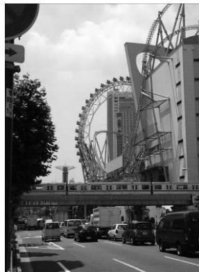
遊園地の施設と 地下鉄丸ノ内線（本郷）

特徴的な施設や市街地の中に設置されたオブジェ等のアート作品が、個性的なまちかどの景観を演出しています。