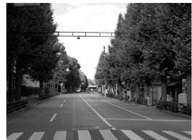
街路樹が潤いを与えている（目白通り）

幹線道路沿いには、区の木としても指定されているイチヨウを中心にハナミズキやトウカエデなど、多くの街路樹が植えられています。街路樹は緑のネットワークを形成するとともに、豊かな緑が生い茂ることによって潤いのある景観をつくりだしています。