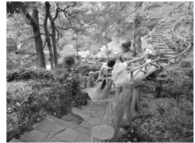
町会が行う公園の清掃活動 (須藤公園 景観活動賞受賞)

地域住民や民間企業、NPO等により、道路や公園の清掃活動が盛んに行われており、公共空間の清潔感のある景観が維持されています。