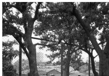
斜面地に建つ住宅の屋根の連なりを一望 (小日向公園)

台地など高台の開けた場所からは、低地の建物や緑を見下ろすことができ、区内のまち並み景観を一望することができます。