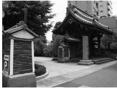
重厚な門構え（吉祥寺）

鳥居、山門や本堂など、歴史を感じさせる重厚な建造物が随所に見られ、身近に歴史・文化に触れることができます。