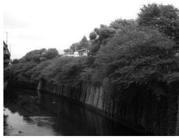
水面に映る岸の並木（江戸川橋）

神田川沿いの要所には並木や量感のある豊かな緑がある。それらの緑と水がつくる空間は、都市の中で潤いを感じさせる景観となっています。