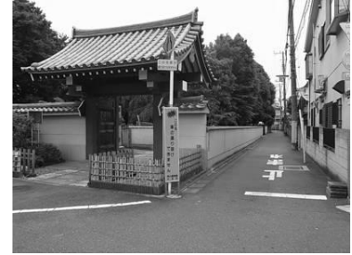
周辺からも見ることもできる寺院の緑 （左：瑞泰寺、右：海蔵寺）