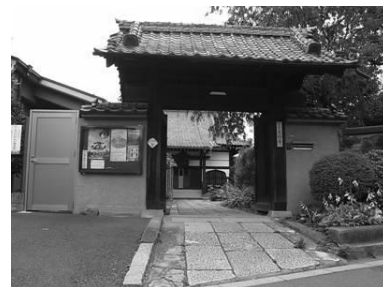
奥行き感のある入口 (左：天祖神社、右：常徳寺)