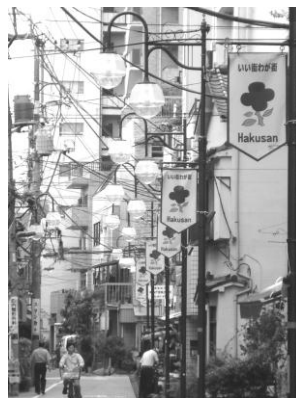
フラッグの統一 (白山下商店会)

インターロッキングブロックなどの舗装整備や照明器具、装飾の統一などにより、商店街の賑わいを演出しているところも見られます。