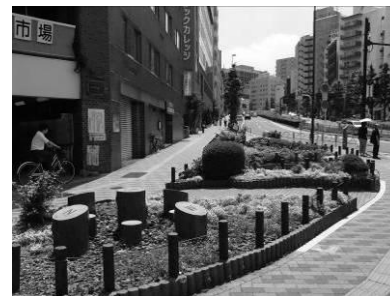
歩道のスペースを利用した ポケットパーク (春日町交差点)