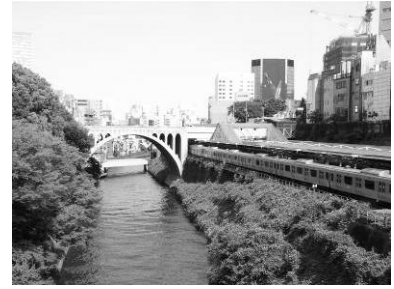
お茶の水橋から下流を見た 神田川の眺め