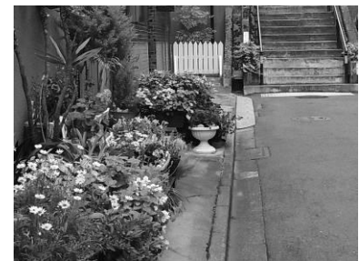
敷地内の空いたスペースに草花を飾りまち並みを演出(湯島)

樹木や鉢植え、草花などをしつらえることにより、通りに面したスペースを豊かに演出している住宅が見られます。こうした住民一人ひとりの小さな取組や工夫が、通りを歩く人にも安らぎを与え、生活感の感じられる生き生きとしたまち並みをつくりだしています。