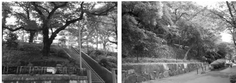
立体感のある斜面の緑 (左：清和公園、右：江戸川公園)

斜面に立地する公園は、地形の変化に富んでおり、立体的で奥行き感のある景観を形成しています。