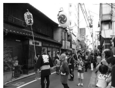
根津神社の例大祭