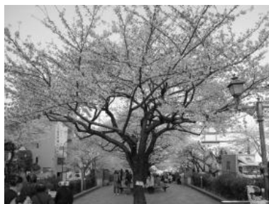
さくらまつり（播磨坂）

播磨坂の「さくらまつり」を始め、根津神社の「つつじまつり」、白山神社の「あじさいまつり」、湯島天満宮の「菊まつり」「梅まつり」は、「文京花の五大まつり」として親しまれ、四季折々の花がつくる潤いある景観を見ることができます。