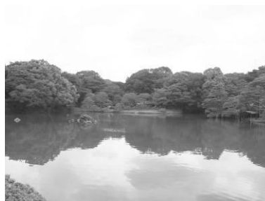
池越しに広がる空（六義園）