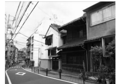
歴史ある建物が残る景観（本郷）

本郷や湯島など、区内には、江戸から昭和初期にかけての歴史の深い建築物が見られる住宅地があります。そうした住宅地は、地域の歴史や文化を感じることができるとともに、歴史に培われた趣のある景観が見られます。