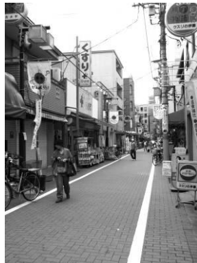
生活用品店が並ぶ地蔵通り商店街 (関口)

区内には多くの商店街があり、景観も様々です。中には歴史ある建築物が残され、活用されているものなど見られます。