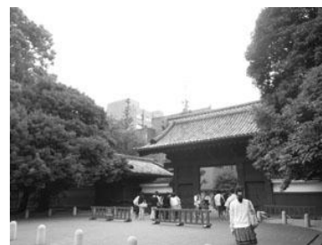
本郷通りのシンボルとなっている東京大学の赤門

六義園や小石川後樂園を始め、東京大学の赤門として親しまれている旧加賀屋敷御守殿門や護国寺、吉祥寺、伝通院、根津神社、湯島天満宮など区内には、文化財としての価値が高く評価されている建造物や歴史を感じさせる佇まいを持つ寺社仏閣も数多く存在します。それらは、区の歴史の深さを象徴するとともに、地域の景観のシンボリックな存在となっています。