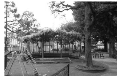
木陰をつくる樹木と遊具 (左：久堅公園、右：西片公園)