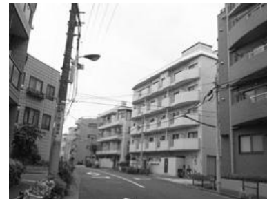
中層建築物が建ち並ぶまち並み （左：本郷、右：教育の森公園周辺）