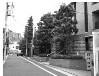
石積みの塀と豊かな植栽を施した集合住宅（小日向）

樹木や生垣を外構に施している住宅が多いため、緑豊かで潤いのある住宅地の景観が形成されています。小日向は敷地規模が大きく、建物自体は奥に、道路側には緑を配置している住宅が多く、全体としてゆとりと豊かさを醸し出しています。