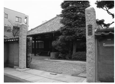
本堂のどっしりとした瓦屋根 （浩妙寺）