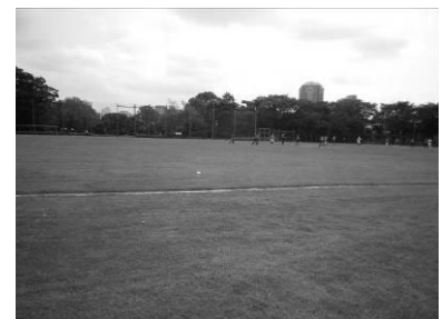
遮るもののない広い視界 （目白台運動公園）