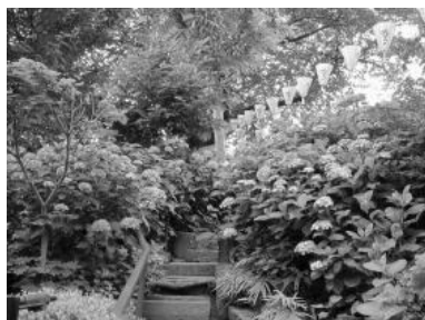
あじさいまつり（白山神社）