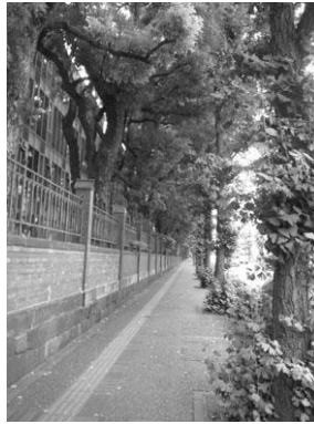
煉瓦塀から歩道に溢れる緑 (東京大学)

敷地内にあるまとまった緑が、塀越しに見えたり、透過性のある塀などにより敷地外からも緑を身近に感じたりすることができ、潤いのある緑視率の高い景観となっています。