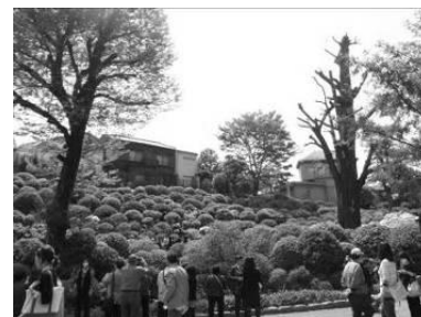
つつじまつり（根津神社）