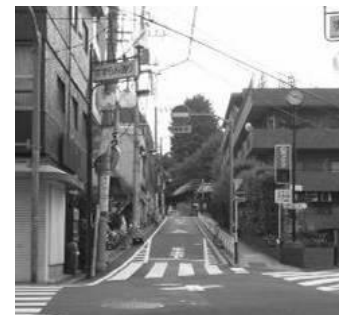
アイストップに緑がある (善光寺坂 小石川2丁目)

坂道では、視線の先に見えるものにより受ける印象が大きく異なります。例えば豊かな緑や東京タワー、富士山といったランドマークとなる建造物などが見える場合、それらがアイストップとなり、坂道の景観をより印象深いものとしています。近年では、スカイツリーが見える坂道もあります。