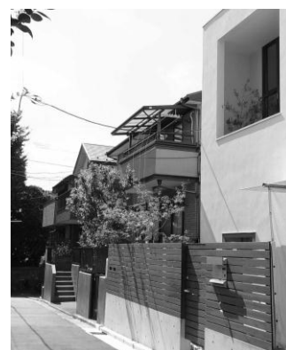
外壁の凹凸や自然素材を用いたルーバーなどの外構の工夫が見られる低層集合住宅（小日向）

敷地規模が大きくないため、前庭や豊かな樹木を設置するスペースがない場合でも、住宅の外壁の意匠・素材や外構の工夫により、まち並みに表情を与えているものが見られます。