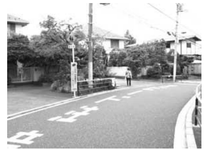
緩やかな曲線状の道路と沿道の緑豊かな戸建住宅（小日向）

小日向は、細い路地に囲まれた短冊状の街区など、江戸時代末期の町割りを継承しており、全体的に道路幅員が狭く、T字路や屈曲した道路が多い独特の空間が形成されています。また、西片は、比較的幅員の広い道路に囲まれた街区が形成されており、それぞれに個性あるまち並みが歴史性と風格を感じさせています。