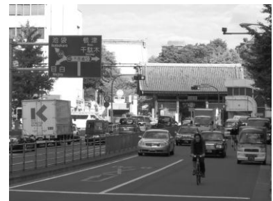
視線の先に護国寺が見える（音羽通り）

幹線道路は幅員が広く、音羽通りのような一直線に伸びた道路や緩やかな曲線の道路が多いため、遠くまで見通しのきく景観が形成されています。