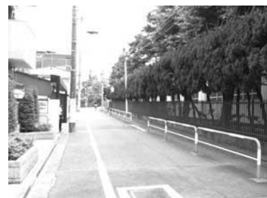
見通しの良い通りと学校敷地の植栽（教育の森公園周辺）