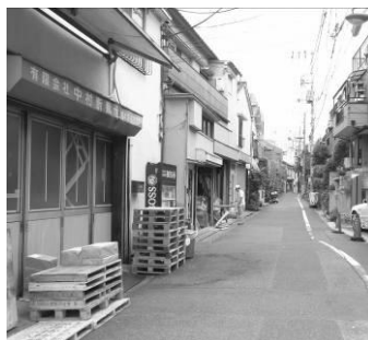
地場産業の集積（千石）

通りからも作業が行われている様子が見られ、文京区を代表する産業が醸し出す特色ある景観が広がっています。