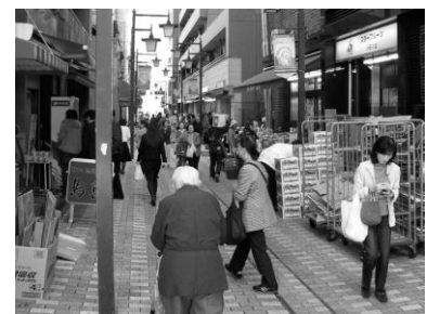
舗装整備された商店街 (柳町仲通り商店会)