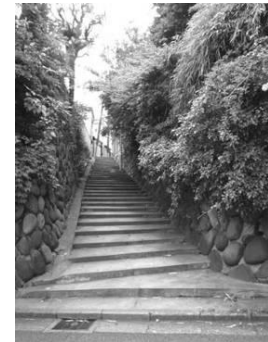
石積みの擁壁 (藪下通り脇の坂道 千駄木1丁目)

沿道の建物や擁壁、敷地内の緑、路面の仕上げなどは、坂道の景観を構成する重要な要素です。季節を感じられる緑豊かな坂道では、心が安らぐ景観が見られます。また、緑化が施された擁壁や石積み擁壁、歴史的な建物や史跡などがある坂道では、歴史や懐かしさを感じさせる景観が見られます。