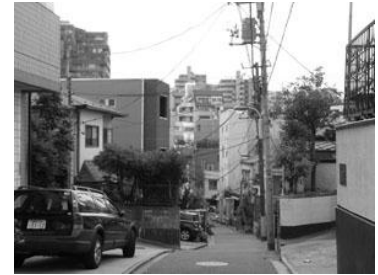
坂上から見下ろす景観 (梨木坂 本郷4、5丁目)

坂道では高低差によって景色が大きく変化します。坂道を見上げる場合と見下ろす場合では、異なる景観が見られます。坂下から見上げる場合、台地の低層・中層住宅地を望む場合が多く、坂道を上るにしがたい視界が開けます。また、坂上から見下ろす場合、低地の幹線道路方面を望む場合が多く、遠景には高層建築物が幾重にも重なって見えるなど、見る場所によって異なる景観を楽しませてくれます。