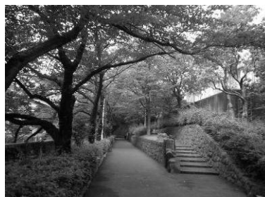
神田川沿いの桜並木 (江戸川公園入口)

地形を感じさせる緩やかな曲線や、水面や岸辺の緑などにより、都市空間の中で自然を強く認識できる景観となっています。