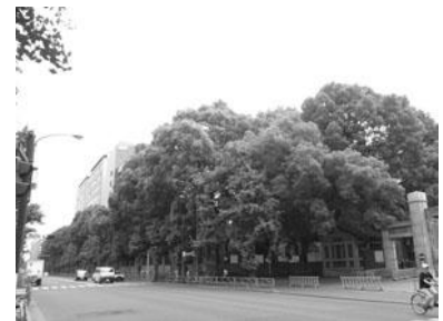
ボリューム感のあるまとまった緑 （左：護国寺、右：東京大学）