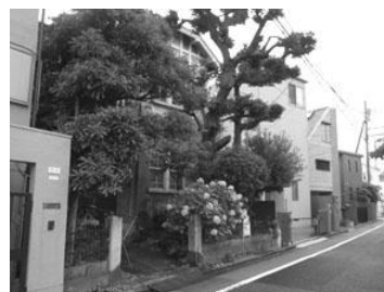
敷地内の緑がまち並みに潤いを与えている（橋本家住宅）

また、邸宅等の小規模な歴史的建造物が建つ敷地には、高木が残っている場合が多く、敷地内の緑がまち並みに潤いを与えています。