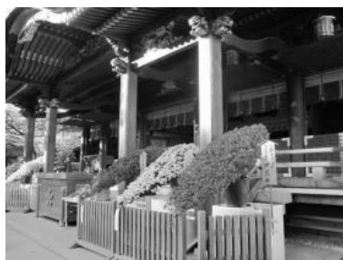
菊まつり（湯島天満宮）