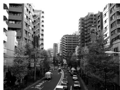
本郷通りのイチヨウ並木