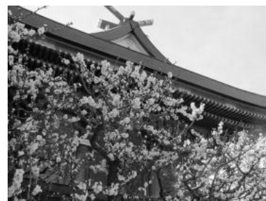
梅まつり（湯島天満宮）