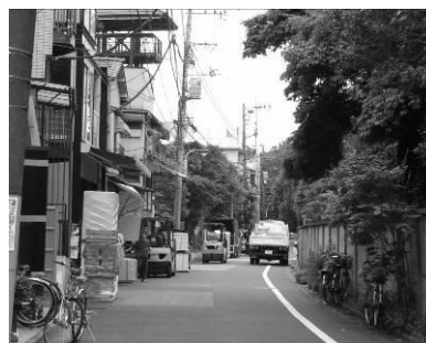
働く様子も景観のひとつとなっている（白山）