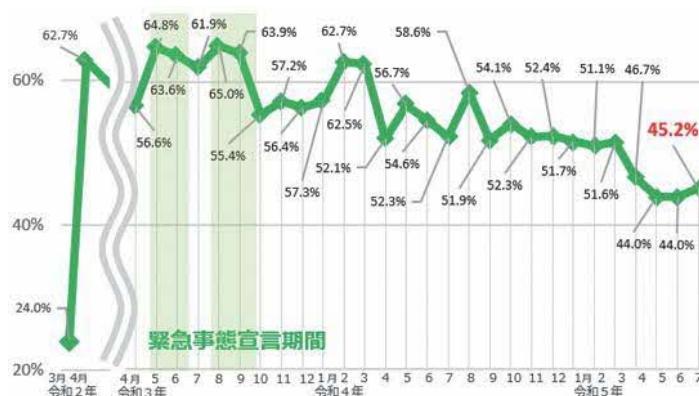
図表1-4 テレワーク実施率の推移（都内企業）