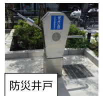
(写真はイメージです)