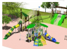
複合遊具(児童用・幼児用)