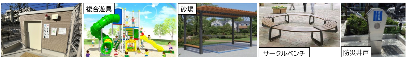
バリアフリートイレ