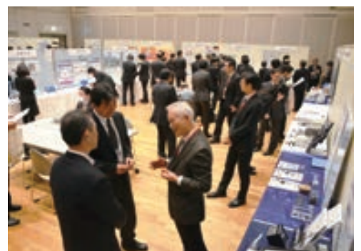
展示会・交流会当日の様子

今後も、文京区では、医療機器に関わるものづくり企業を有する自治体との連携を進めていきます。