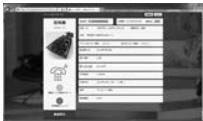
電話着信時に、お客様の様々な情報が表示される。

こういったお客様の知りたい情報が、電話着信時にパソコンやタブレットに表示されるため、ベテランではなく経験の浅いパートやアルバイトでもスムーズな電話対応が可能となります。お客様からの電話を誰が取っても、失礼なく、気持ちのいい対応が可能となるのです。