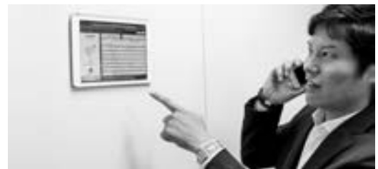
壁に貼り付けたiPadで着信情報を見る。

確認できます。お客様からの着信履歴があれば、自宅からすぐに電話を折り返すということも可能です。これでお休みのときに電話を自分の携帯に転送するというのをやらなくてすむようになります。