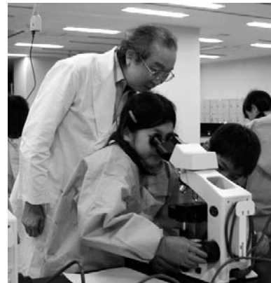
夏休み子どもアカデミア

医療現場のニーズを文京区内の企業に解決していただく試みとして、医師、看護師が医療現場の問題点を発表する試みを行いました。よりよい医療の提供を目指しつつ、地域の産業の発展にもつながることを期待しています。