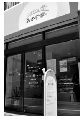
パラダイスおかず家

商店街の更なる発展には若手リーダーの選出、IT広告媒体の活用、デリバリー人員の共有化、イベント企画、ミニスーパーなど生鮮食料品店の誘致が重要と感じています。この実現には、商店街の協力体制と行政の協力が不可欠です。当店では、もっと元気な商店街になるために今後も商店街の仲間と新たなチャレンジを続けたいと思います。