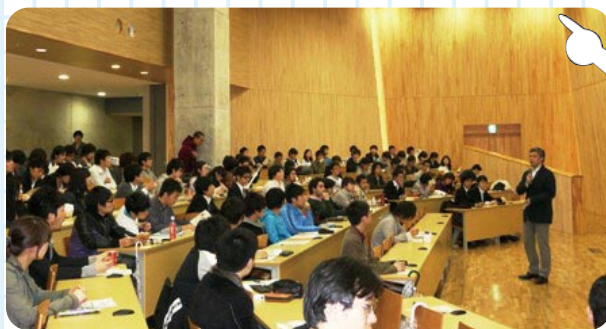
アントレプレナー道場の風景 2面特集より