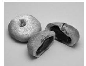
開発中の「白山あんパン」