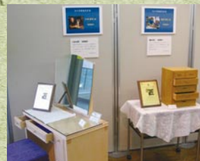
文の京技能名匠者展

今年度は審査の結果、7人の方を認定し、認定された方の作品を1月25日(火)から28日(金)まで、文京シビックセンター1階 Bunkyo アンテナスポットで展示紹介しました。