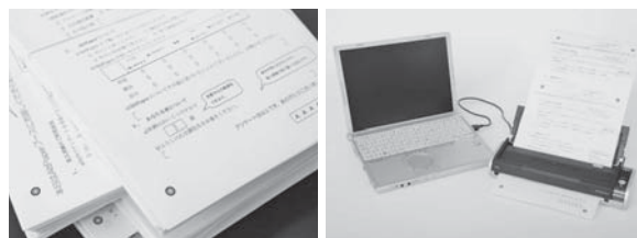
大量の紙アンケートも「AltPaper」を活用すれば短時間で集計できます。

起業の面白さは、自分の手で世の中をちょっと変えられることです。もう私も文京区に住み始めて10年になります。いつか地域や大学に恩返しできるようになりたいですね。