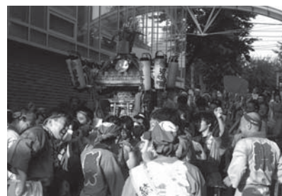
根津神社の祭りで、地元神輿がキャンパス内に入る。担ぎ手には本学学生も多く参加しています。