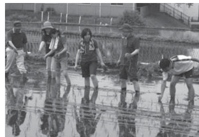
農業インターンシップ 田植えの風景

本学の生涯学習センターと文京区が連携して実施している講座で、終了後はリサイクル推進サポーターとして、区主催の活動にご協力いただいています。