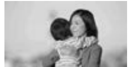
インターネットにて公開中のサイボウズワークスタイルムービー「大丈夫」

ムービーを見た方からの反響として、母親ばかりが家事・育児を担っているようだが夫もしたらどうか、夫がもう少し家事・育児に参加できるように職場の環境は改善できないのかなど様々な意見が交わされています。子育て当事者だけでなく、子育て未経験者の方も交え、仕事と子育てについての議論が巻き起こっています。