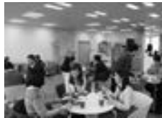
サイボウズ本社の様子

サイボウズは、社員の声をとりいれながら妊娠や出産をしても安心して働き続けられる職場づくりに取り組んだところ、離職率が28%から4%以下にまで低下し採用や教育コストを抑えることができました。グループウェアというチームの情報共有を支えるツールを開発・販売していますが、時間や場所を超えてコミュニケーションでできるため、柔軟な働き方が実践できています。ワークスタイル変革のモデル企業として注目され、新たなクラウドの事業も順調に伸びています。