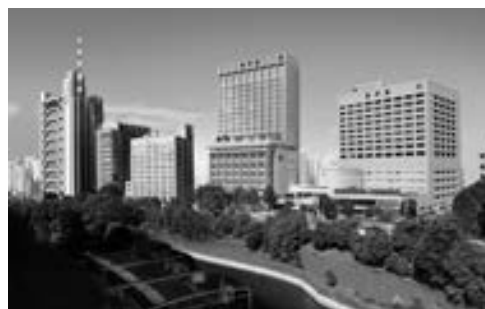
再編を進めている本郷・お茶の水キャンパス (2016年完成予想図)

医学、スポーツ健康科学、看護学系の4学部3研究科と6附属病院を有し、健康総合大学・大学院大学として、人々の健康維持・増進・回復に貢献する人材育成に努めてまいりました。2015年4月に第5番目の学部として新設する国際教養学部では、国際社会の多様な価値観の中で自立し、周りの人々と共生して主体的に生きることができる「グローバル市民」の養成を目指します。