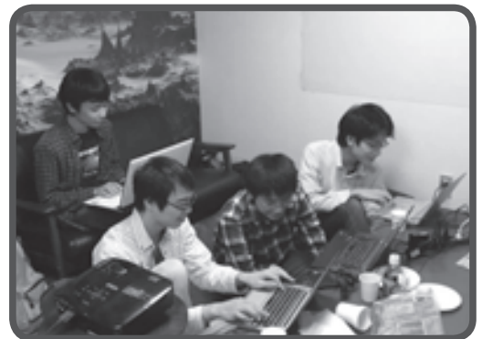
クリエイターのコラボレーション

今後はハッカソンハウスと同様の家を運営したい方との繋がりを広げ、このクリエイター同士の輪を文京区全体に広げていく「ハッカソンビレッジ構想」を推進していきたいです。そして、文京区から世界に向けてプロダクトを継続的に生み出す仕組み作りに挑戦していきます。