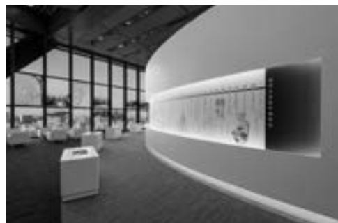
日本医学教育歴史館

創立175周年記念行事の一環として2014年4月に開館した「日本医学教育歴史館」は、資料展示などを通して日本の医学教育の歴史を検証できる国内初の施設です。館内には、杉田玄白の「解体新書」や、戊辰戦争（1868～69年）時に奥羽追討陸軍病院に掲げられていた病院旗、江戸時代に順天堂が入手した英国式日光顕微鏡など約120点に及ぶ資料を展示しています。入場無料でどなたでもご覧いただけますが、事前予約が必要となりますので、詳しくはホームページ（URL： http://www.juntendo.ac.jp/jmehm/ ）をご覧ください。