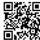
【事前相談フォーム】