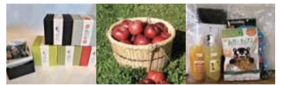
※写真は当選賞品の一例

〒112-8555 文京区アカデミー推進課都市交流担当 ☎03-5803-1310