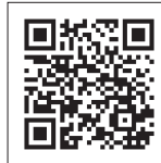
▲新施設予約システムQR (1/19(水)から)