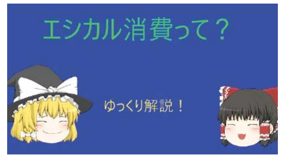
「【ゆっくり解説】今話題?のエシカル消費って?」 金お