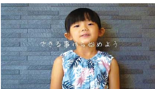
「できる事から始めよう」 ヨコ