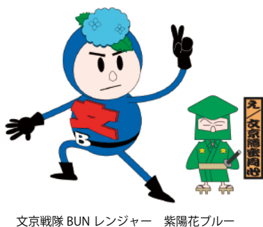
文京戦隊 BUN レンジャー 紫陽花ブルー