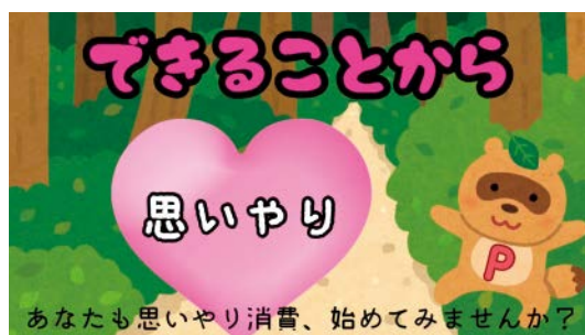
「できることから始めよう」 ちい