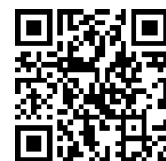
▲B-ぐる運行情報サービス