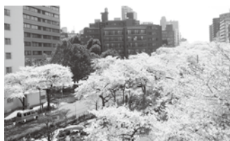
文京さくらまつり (3月) Bunkyo Cherry Blossom Festival (March)

★は文京花の五大まつり ★Five Major Flower Festivals of Bunkyo