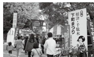
根津・千駄木下町まつり (10月) Nezu/Sendagi Shitamachi Festival (October)