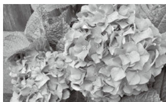
文京あじさいまつり (6月) Bunkyo Hydrangea Festival (June)