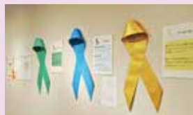
▲カラーリボンフェスタ