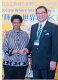
文京区長 成澤 廣修 ▲UN Women事務局長ブムズイレ・ムランボ＝ヌクカ氏(左)と成澤区長

UN Women日本事務所には、是非区内の小・中学校等を回って国際理解教育を担っていただくとともに、区内の企業や女性関係団体とも連携を強めて、文京区からさまざまな発信をしていくことを期待しています。