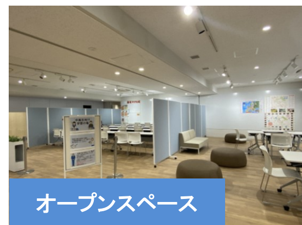
オープンスペース