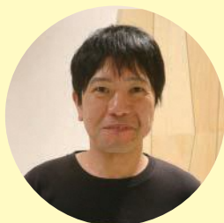
文京区内認知症対応型 共同生活介護 (グループホーム)

今の会社で取り組んでいる現役世代向けの介護相談や情報提供に価値を感じているので、介護現場に出ながら続けていきたい。