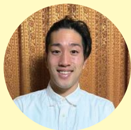
株式会社グッド ライフケア東京 グッドライフケア江東

10分程度の安否確認でも、ただ決まった項目をチェックするだけでなく、“専門職としての気づき”が必要とされる仕事だと思う。その専門性を突き詰めることが重要であると考えている人が少しでも増えてくれるよう、伝えていきたい。