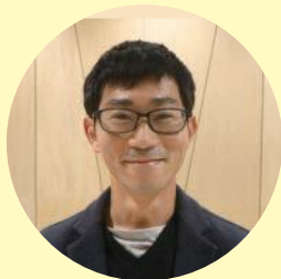
株式会社ケアワーク弥生 小規模多機能型居宅介護 ユアハウス弥生