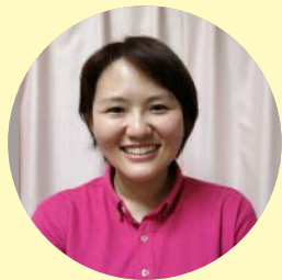
社会福祉法人寿心会 フォーライフ桃郷

手相では2年後に結婚できることになっている(笑)。結婚しても介護の仕事は続けたい。今年は、ケアマネジャー等の資格の取得を検討している。