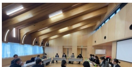
様々に工夫された天井