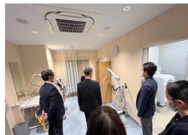
機械浴前の脱衣所