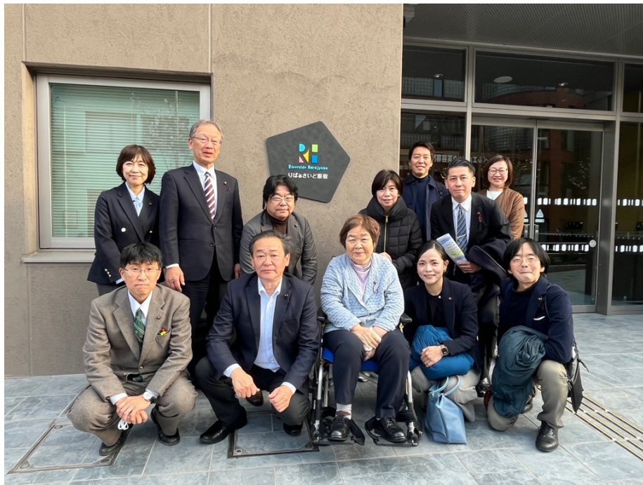
りばあさいど原宿前にて