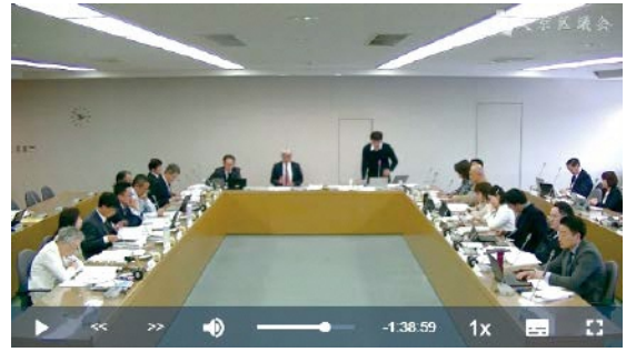
▲試行的に公開した予算審査特別委員会中継の様子

令和6年から予算・決算審査特別委員会についても生中継と録画中継を公開することになりました。