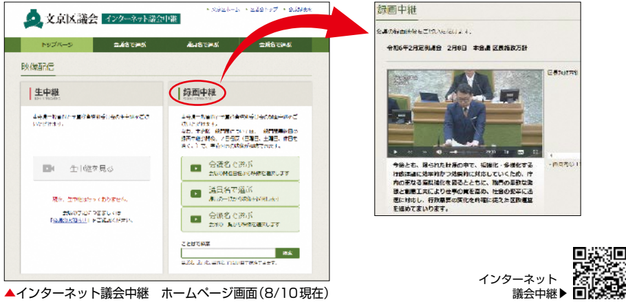
▲インターネット議会中継 ホームページ画面(8/10現在)

より多くの皆様に議会の活動を知っていただけるよう、本会議一般質問等の様子を生中継と録画中継で公開しています。