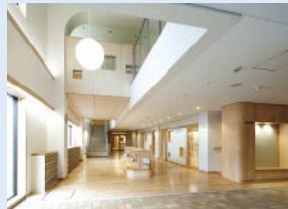
▲エントランスホール

内装には木材を活用し、温かみのある空間を創出しています。今後、認定こども園化に向け、園庭の整備を進めます。