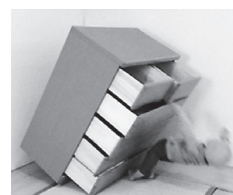
事故のイメージ映像

子どもが引き出しを同時に複数段開けたか、引き出しに乗るかぶら下がったため、転倒防止を施していなかったたんすが前に転倒したものです。