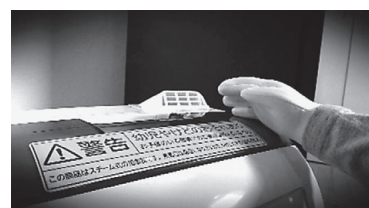
事故のイメージ映像

なお、本体表示及び取扱説明書には、「蒸気口に手や顔を近づけない、やけどのおそれがある。特に子どもには注意する。」旨の記載がありました。