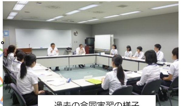
過去の合同実習の様子